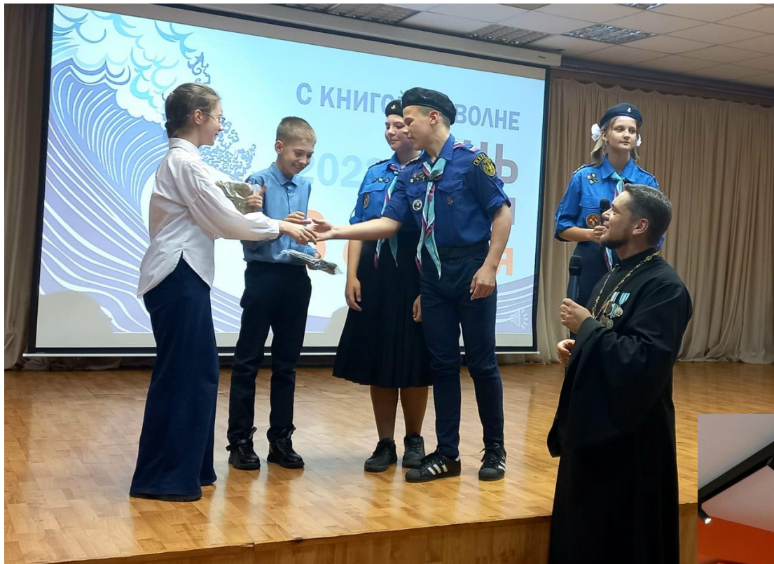
Центральная городская библиотека им. Бажова г. Лесной «Моряки с разбитыми коленками»