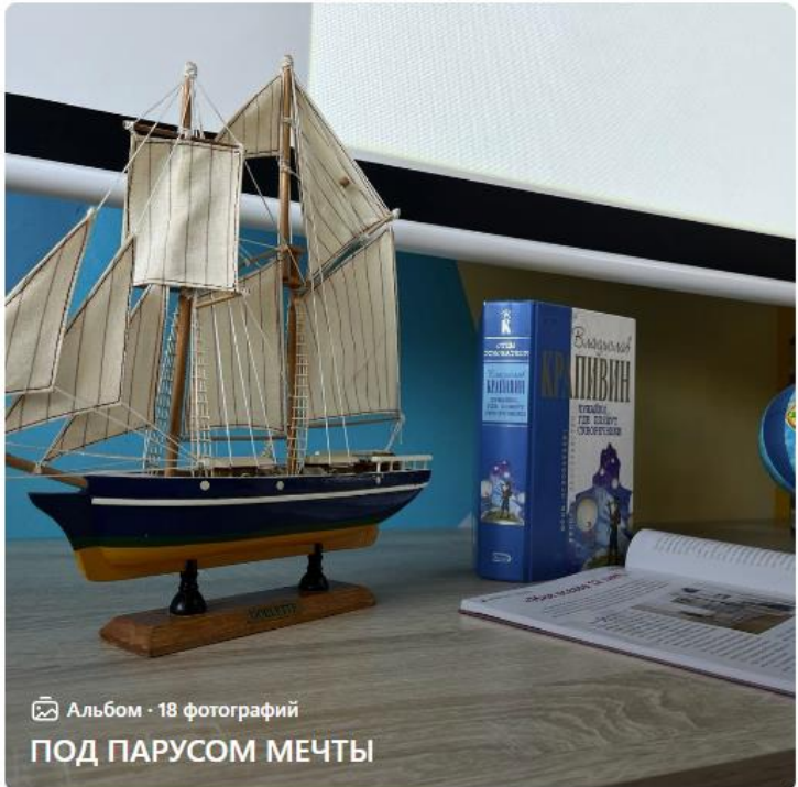
Альбом - 18 фотографий ПОД ПАРУСОМ МЕЧТЫ

#события_библиотека13@biblioteka13_ku #новости_библиотека13@biblioteka13_ku #читаемКрапивина