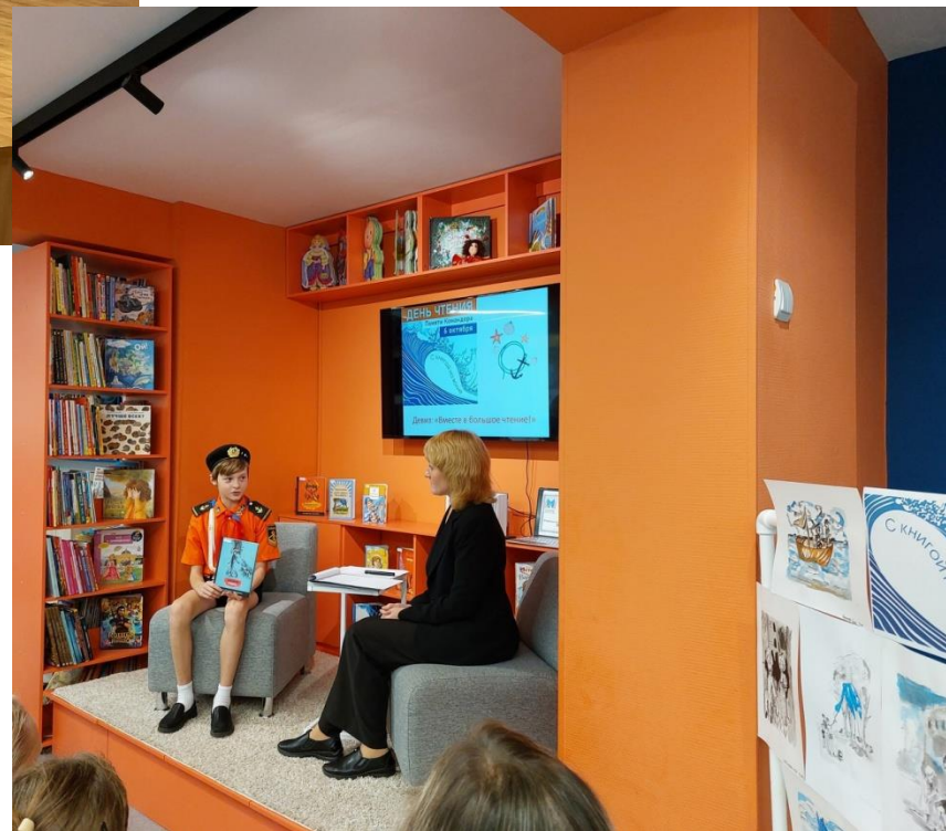
Детская библиотека ГО Ревда