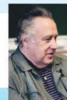
КРАПИВИН Владислав Петрович Биобиблиографический указатель

http://www.teenbook.ru/biblioteka/portfolio/nashi-izdaniya/