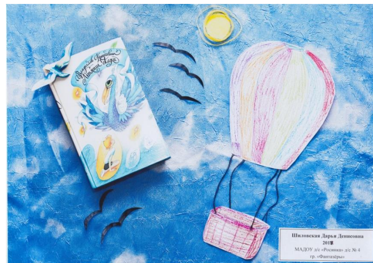
Буклук – книжный натюрморт, Новоуральский ГО