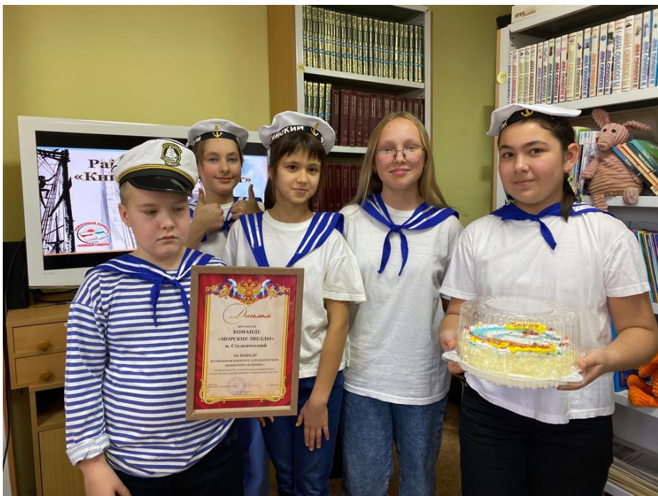
конкурс для подростков «Книжный следопыт» Белоярский ГО