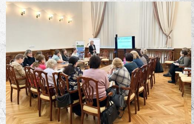
СОУНБ им. В. Г. Белинского