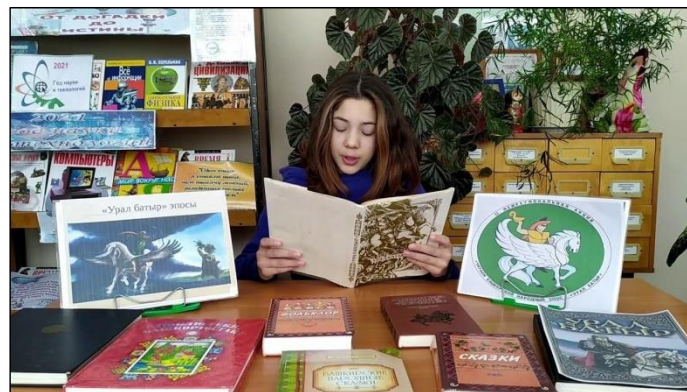
Проект «Башкирский язык: изучаем, читаем, поем», Централизованная библиотечная система Каменск-Уральского городского округа