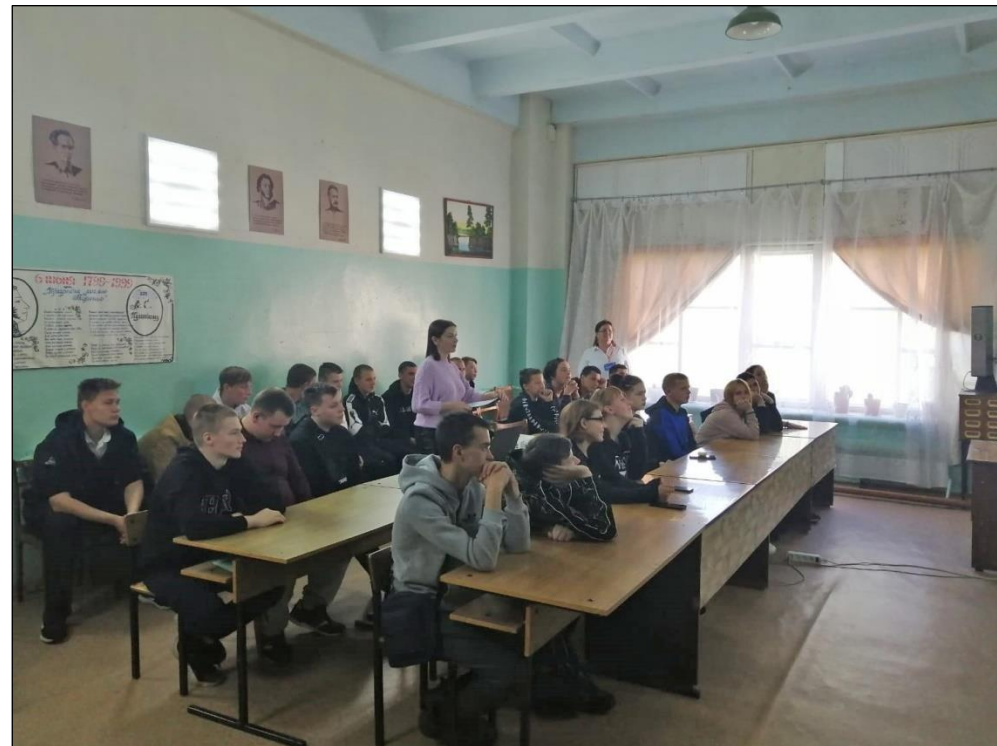
Проект «К сокровищам русского языка», Туринская централизованная библиотечная система