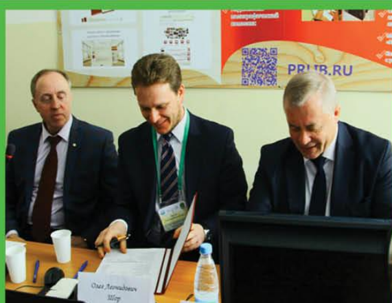
ОТКРЫТИЕ УДАЛЕННОГО ЭЛЕКТРОННОГО ЧИТАЛЬНОГО ЗАЛА ПРЕЗИДЕНТСКОЙ БИБЛИОТЕКИ