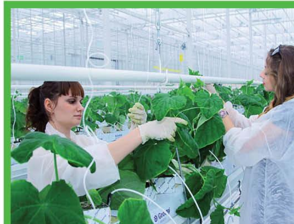
ОТКРЫТИЕ ОПЫТНЫХ УЧАСТКОВ (ПРАКТИЧЕСКИЕ НАВЫКИ АГРОНОМА)