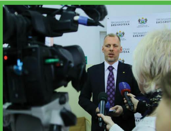
ОСВЕЩЕНИЕ ПРОЕКТА ПРИ ПОДДЕРЖКЕ ИНФОРМАЦИОННО- ПРОСВЕТИТЕЛЬСКОГО ЦЕНТРА ТЮМЕНСКОЙ ОБЛАСТИ