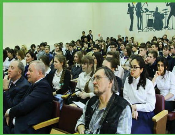
АГРАРНАЯ ШКОЛЬНАЯ КОНФЕРЕНЦИЯ