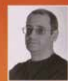
Автор-текста Денис Горелов

Франция любила своих жуанков. Их слава Мольер и иерарх Бельмондо. Италия тоже любила жуанков. Им посвящена литература Возрождения и большой кусок творчества Челентано. Русская пуговчатая традиция много моложе — зато мы изобрели интеллигентного вора, а вернее, ворующего интеллигента Дяточкина. Жуанк с Шекспиром, жуанк-бесребренник — в этом был привкус хорошего христианского безумия, за который мир всегда ценит русскую литературу. Оценки и Дяточкина. В перечне лучших продаж на зарубеж «Берегись автомобиля» пропустила вперед себя только «Анну Каренину» и «Войну и мир». За Толстым будете, Юрий Иванович.