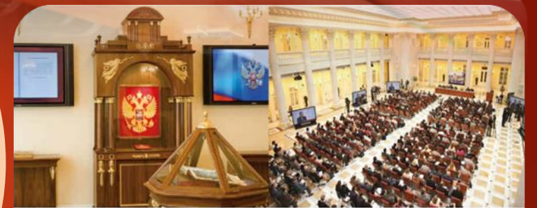
Президентская библиотека имени Б. Н. Ельцина