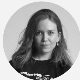
Света проджект- менеджер