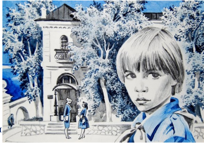
Худ. Е. Медведев