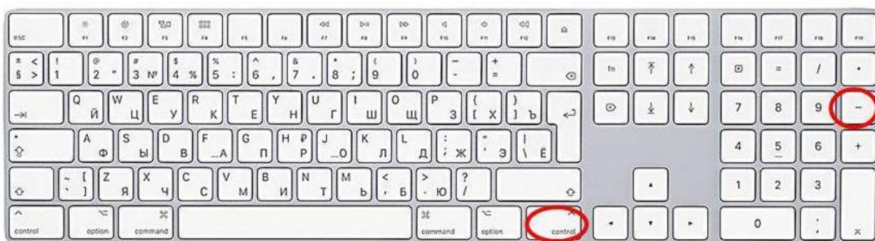
Способ ввода тире

8.2. Способ ввода тире: Ctrl + минус на цифровой клавиатуре.