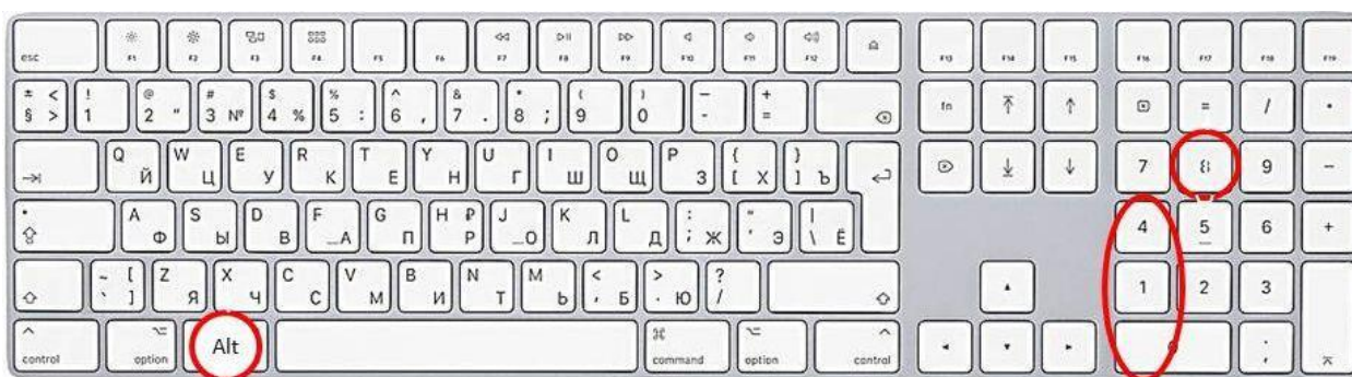
Способ ввода закрывающихся кавычек “лапки”