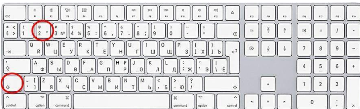
Способ ввода кавычек «елочки»

9.2. Если внутри текста, выделенного кавычками, содержится другой текст, требующий кавычек, он оформляется кавычками типа “лапки” (ЗАО «Издательский дом “Комсомольская правда”»). Для набора кавычек “лапки” нажимается клавиша Alt , набирается 0147 , затем отпускается Alt – получаем открывающиеся кавычки “лапки”. Нажимается Alt , набирается 0148 , отпускается Alt – получаем закрывающиеся кавычки “лапки”.