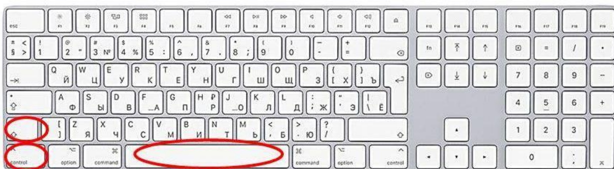
Способ ввода неразрывного пробела

6.1. Чтобы контролировать употребление неразрывного пробела, необходимо осуществлять набор и вычитку текста в режиме, когда показаны все непечатаемые символы, который включается при нажатии клавиши ¶ на панели инструментов.