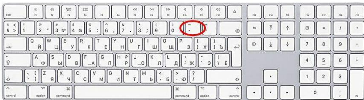
Способ ввода дефиса

7.2. Клавиша для ввода знака «дефис» расположена в верхнем цифровом блоке, делящая клавишу со знаком нижнего подчеркивания (нижний дефис).