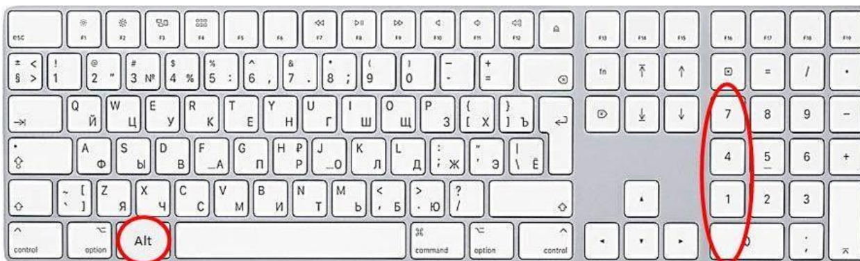
Способ ввода открывающихся кавычек “лапки”

9.2. Если внутри текста, выделенного кавычками, содержится другой текст, требующий кавычек, он оформляется кавычками типа “лапки” (ЗАО «Издательский дом “Комсомольская правда”»). Для набора кавычек “лапки” нажимается клавиша Alt , набирается 0147 , затем отпускается Alt – получаем открывающиеся кавычки “лапки”. Нажимается Alt , набирается 0148 , отпускается Alt – получаем закрывающиеся кавычки “лапки”.