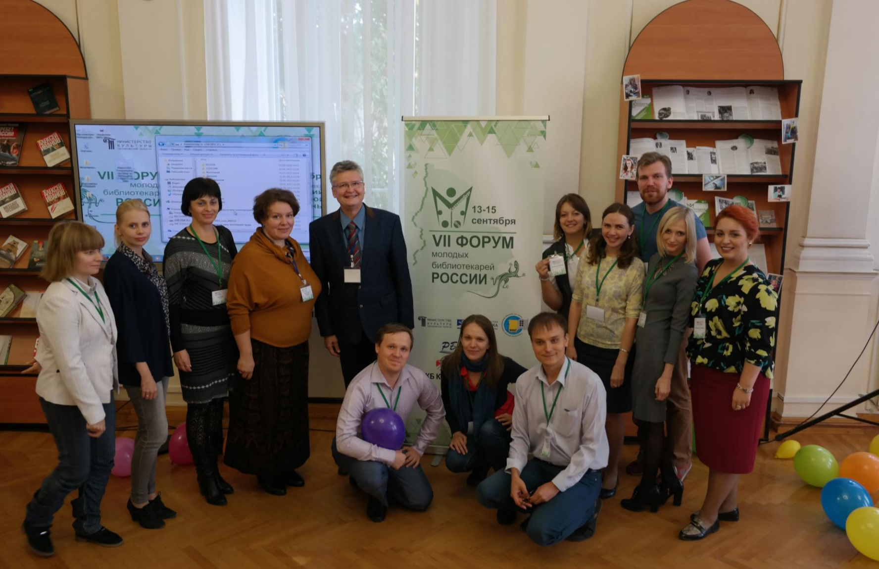
27. Молодёжная секция 29-А. Рабочая группа «Библиотеки и социальные медиа»