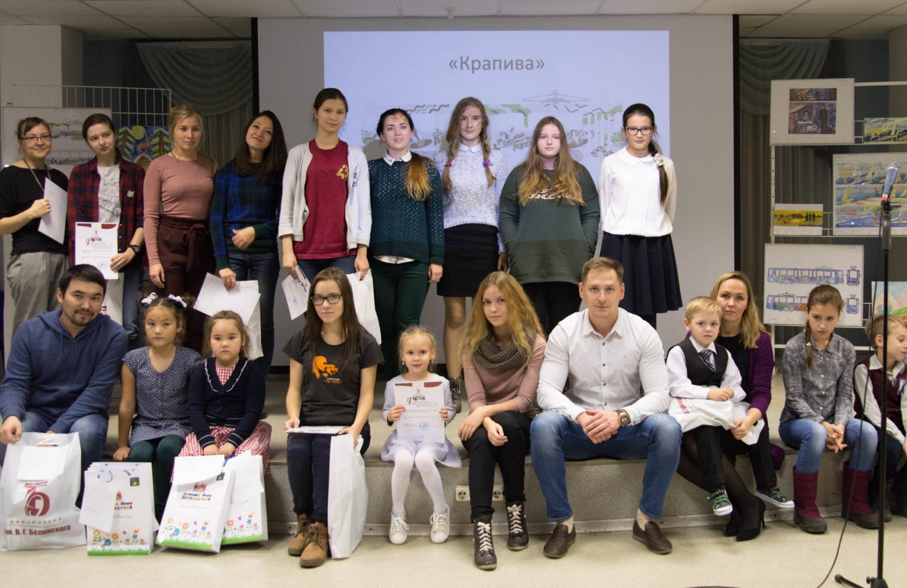
Победитель – команда «Радужка» детского сада №73 города Екатеринбурга.