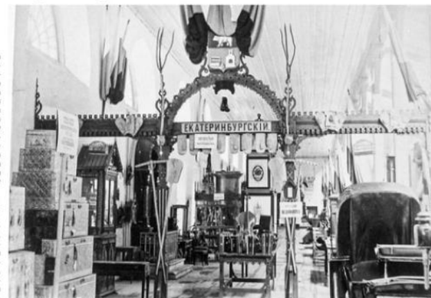
Кустарный отдел Сибирско-Уральской научно-промышленной выставки 1887 года в Екатеринбурге

Получилось промешество известно с древнейших времен. Глина – тот материал, что выкапывается всегда «на руки», да и в обработке удобен, а спрос на изделия поочередно не прекращается. Без посуды ни один-какой не скраш, ни теста не замесить, ни крас-молоко не сохранишь. Легкая да звонкая глиняная посуда была и показателем уровня жи-