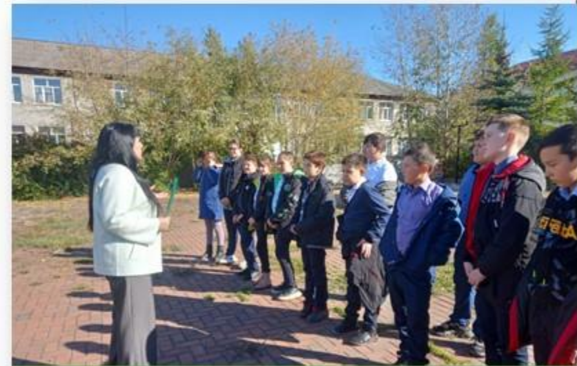
Экскурсионный маршрут «Центральный сквер: от истоков до современности»