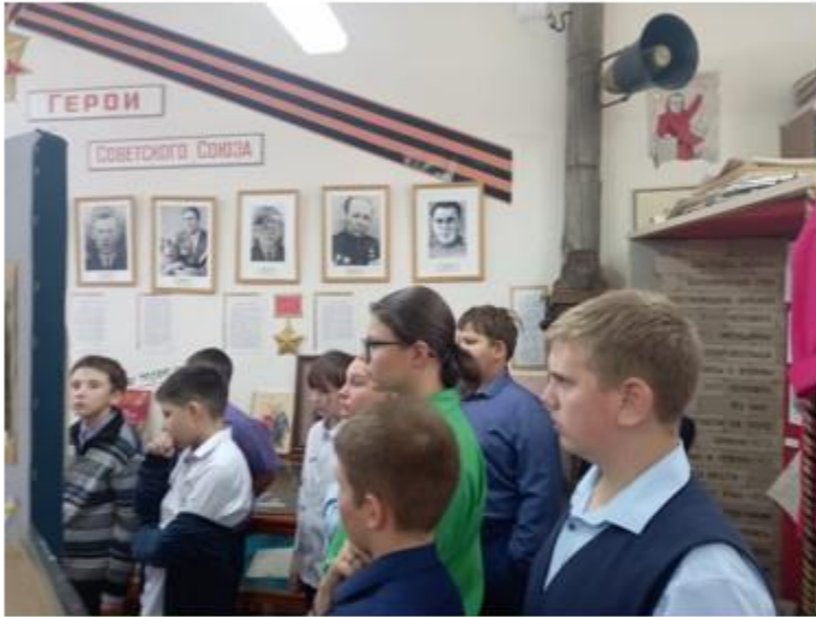
Экскурсионный маршрут «Старая школа: чем жила и как живет»