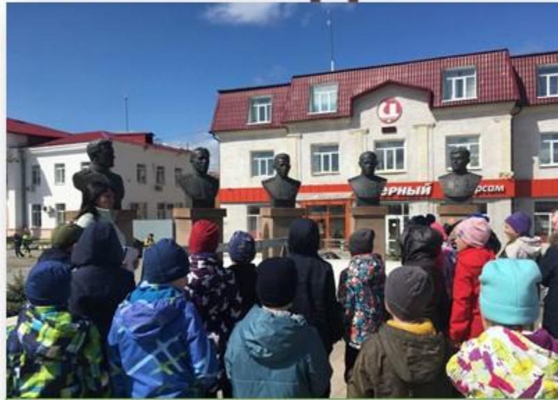
Экскурсионный маршрут «Памяти павших будьте достойны»