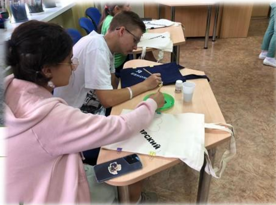
Мастер-класс «Сумка-шоппер «Я люблю Белоярский»