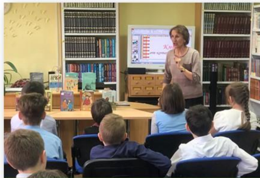
Исторический экскурс «Фамилии Белоярской слободы»