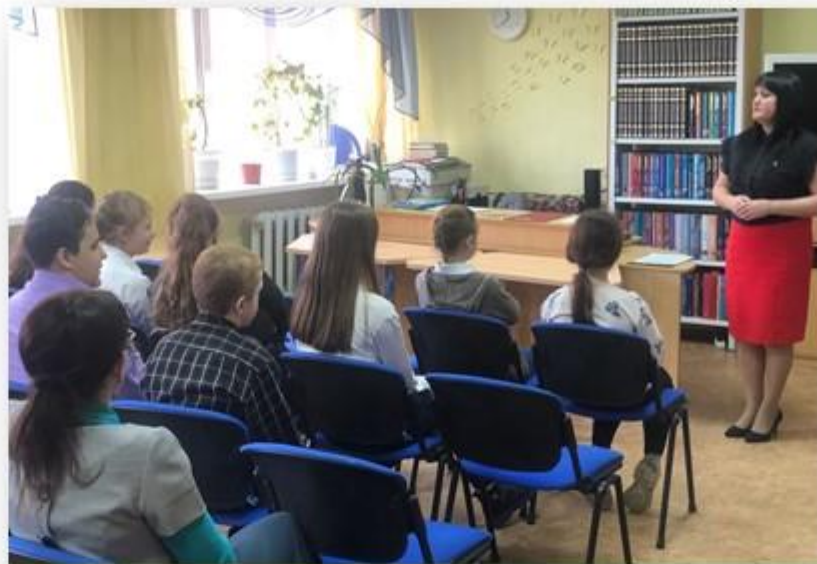
Исторический экскурс «Где находится кукуй?»