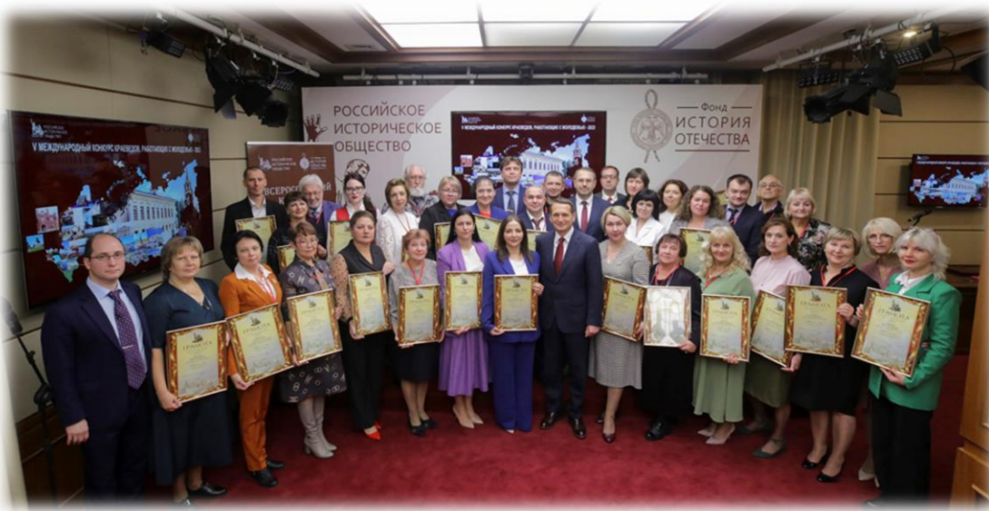
Российское историческое общество г. Москва