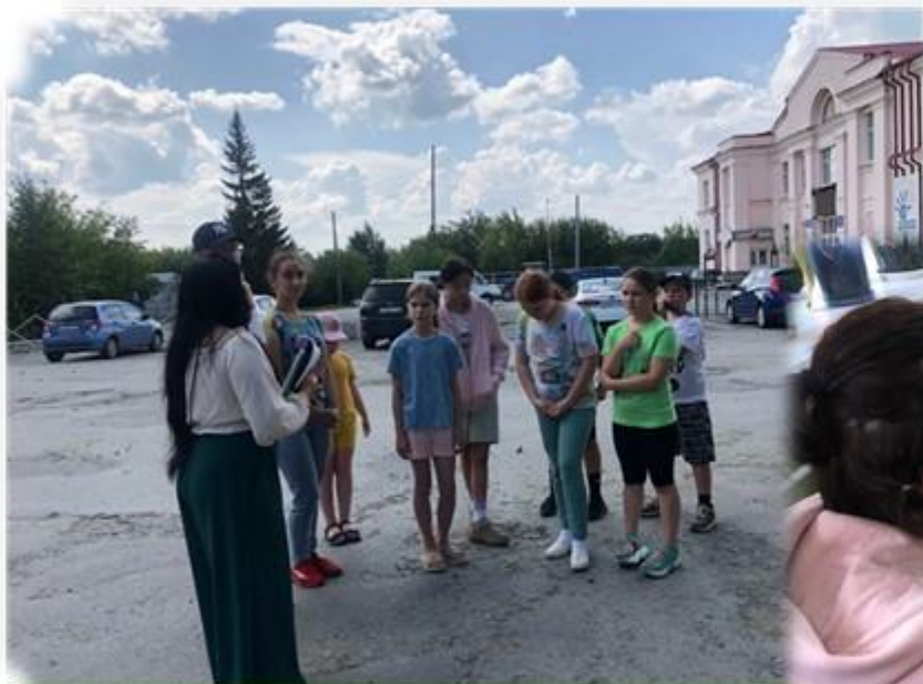
Краеведческая прогулка «История одной улицы»