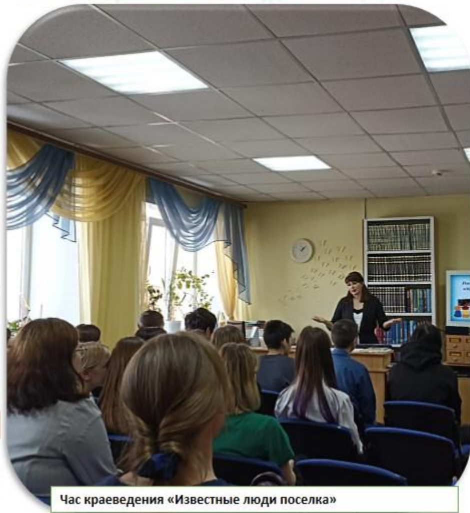
Час краеведения «Известные люди поселка»