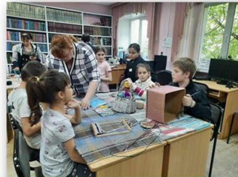
Мастерская уральского ткачества