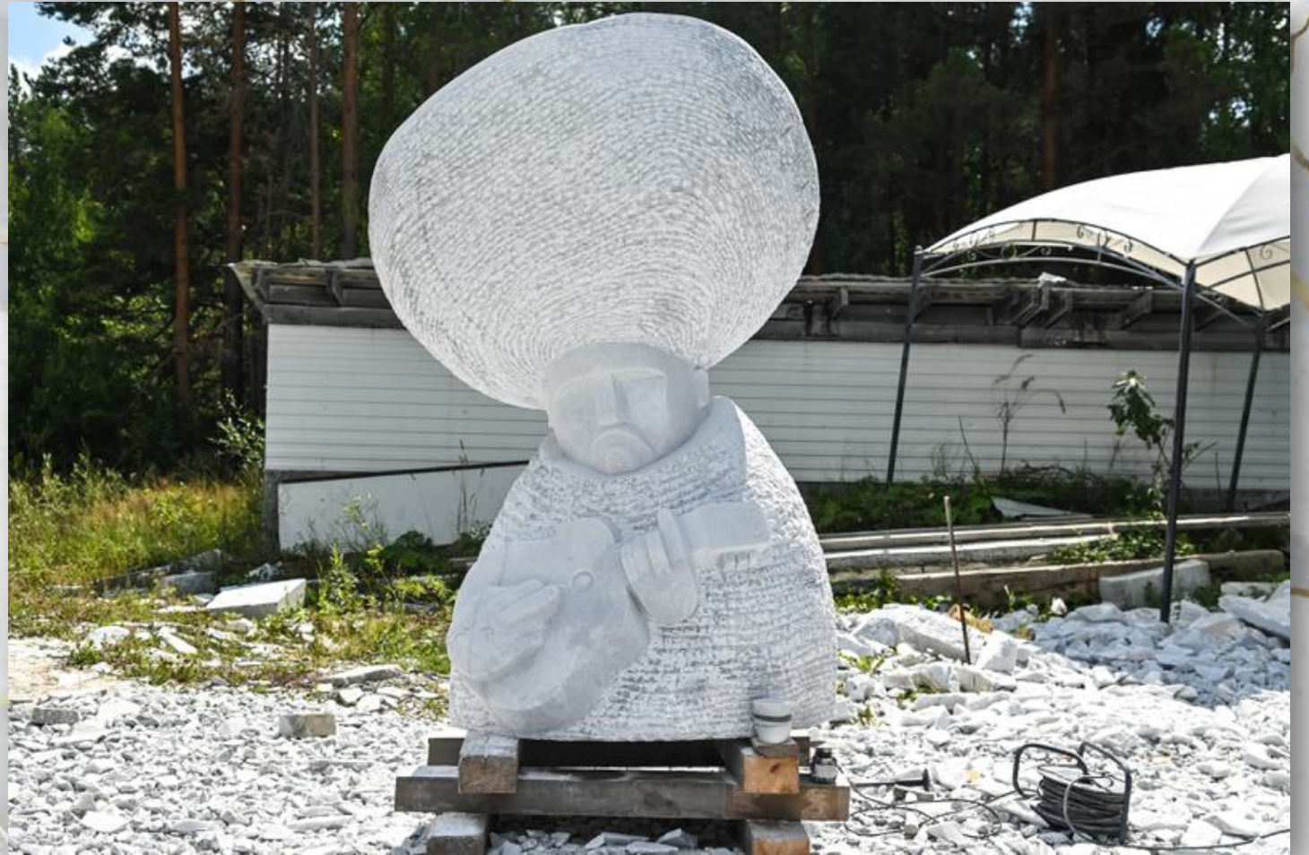
Кирилл Крохолов, Республика Беларусь