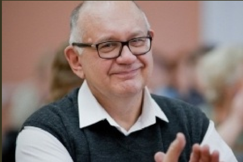
Вадим Осипов, писатель и поэт