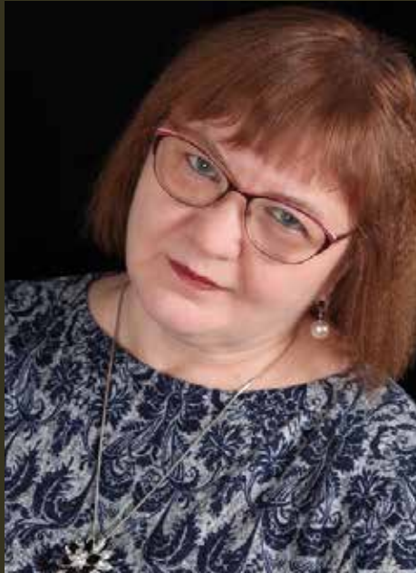
Наталья Паэгле, писатель и журналист