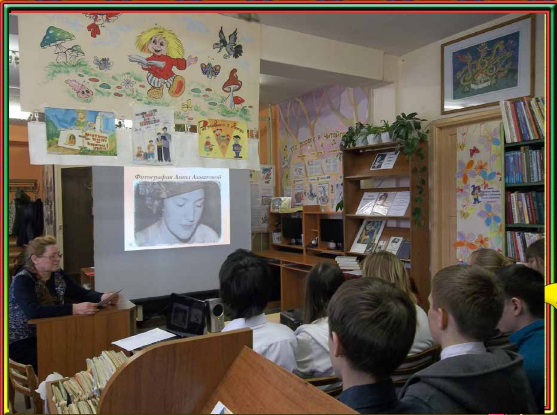
Фотография Анны Ахматовой