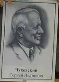
Чуковский Корней Иванович